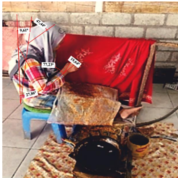
Gambar 3. Postur Kerja sebelum adanya perbaikan