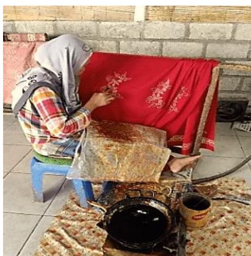
Gambar 1. Postur Kerja pada proses pencantingan

Pada proses pencantingan di Tatsaka Batik, pekerja melakukan aktivitas selama 9 jam per hari selama 6 hari kerja. Proses ini dimulai dari pukul 07.00 hingga 16.00 WIB. Posisi tubuh dari pekerja bagian pencantingan dilakukan proses secara manual dengan postur kerja yang dilakukan dengan posisi duduk dan tangan digambar pada kain yang diletakkan pada gawangan. Proses ini tidak hanya membutuhkan keterampilan manual yang tinggi tetapi juga ketahanan fisik yang baik untuk menjaga konsistensi dan kualitas hasil akhir. Kondisi tersebut melibatkan pekerjaan selama 9 jam dengan melakukan gerakan yang sama secara berulang. Dalam kondisi kerja pada bagian pencantingan dapat dilihat pada Gambar 1.