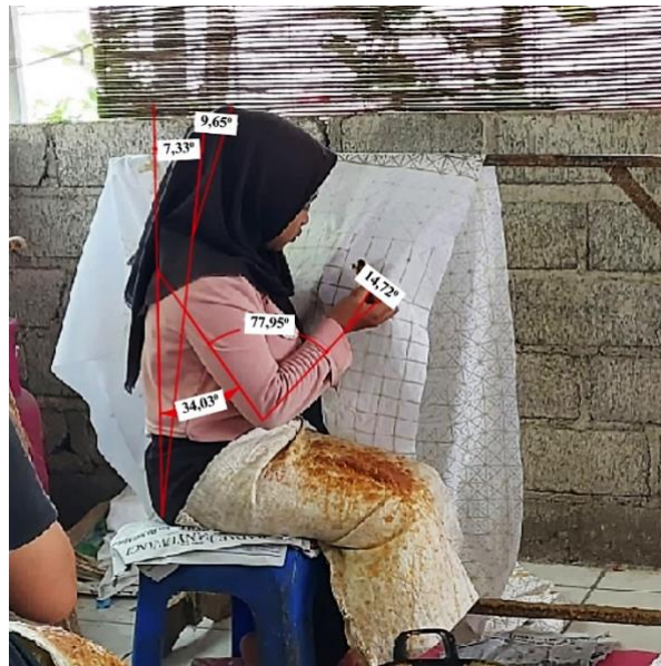
Gambar 4. Postur Pencantingan Perbaikan