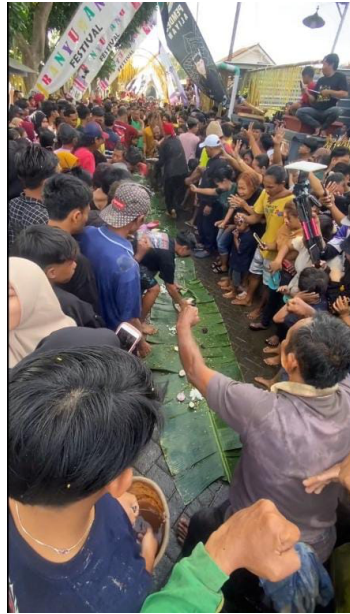
Gambar 3. Prosesi Gelar Songo Ritual Adat Keboan Desa Aliyan

Pada prosesi kedua dalam ritual ini mengajarkan masyarakat untuk mempercayai hal-hal yang berkaitan dengan kekuatan yang tidak dapat dijelaskan secara harfiah. Prosesi ini melibatkan Keboan yang memulai untuk selamatan bersama dengan para leluhur dengan adanya sesaji yang sudah dipersiapkan. Pada prosesi ini banyak pelaku yang terlibat seperti tokoh adat yang berperan sebagai pawang, pelaku Keboan yang dirasuki oleh roh leluhur, dan para keluarga seperti anak dan istri dari pelaku Keboan untuk membawakan beras kuning, dupa atau menyan, dan setimba air untuk membersihkan wajah Keboan yang terkena lumpur. Pada prosesi ini para keluarga mendampingi Keboan dan ini mengajarkan suatu kepercayaan tentang adanya roh leluhur secara tidak langsung tetapi nyata benar adanya. Prosesi ini membuat ritual adat Keboan terasa sangat sakral karena semua Keboan dirasuki oleh roh leluhur dan berkomunikasi layaknya kerbau. Dalam prosesi ritual adat Keboan yang kedua atau disebut dengan prosesi gelar Songo mengandung nilai pendidikan Budaya karena adanya suatu kepercayaan yang dianggap baik oleh masyarakat desa Aliyan karena masyarakat desa mempercayai jika prosesi ini harus dilaksanakan untuk keberhasilan musim panen selanjutnya.