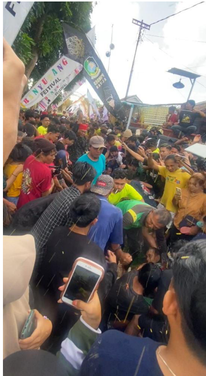
Gambar 6. Prosesi Ngurit Ritual Adat Keboan Desa Aliyan

dengan kepercayaan atas leluhurnya hal tersebut dibuktikan masyarakat dengan menghormati leluhur yang telah memprakarsai adanya Keboan dalam desa tersebut sehingga makam leluhur terus dirawat dan dijaga dan selalu dikunjungi setiap ritual adat dilaksanakan.