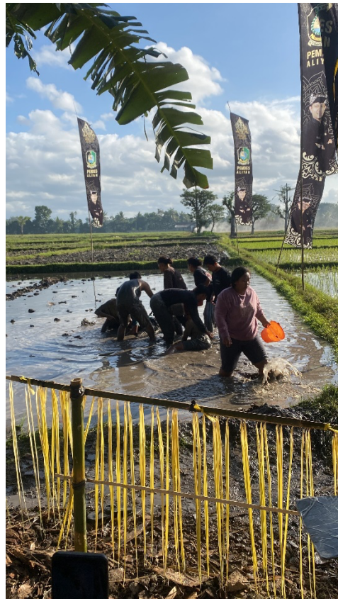
Gambar 4. Prosesi Ider Bumi Ritual Adat Keboan