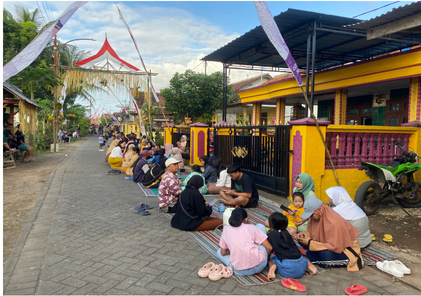
Gambar 2. Prosesi Selamatan Ritual Adat Keboan Desa Aliyan

Pada prosesi pertama masyarakat diajarkan untuk saling bergotong-royong, saling membantu dan dalam prosesi ini masyarakat makan secara bersama-sama sambil duduk melingkar di depan rumahnya masing-masing yang memiliki kesan persaudaraan yang erat antara keluarga dan tetangga yang harmonis. Hal ini juga dapat dilihat dari lauk pauk yang disajikan berupa hasil bumi yang memiliki makna bahwa sangat bersyukur para masyarakat desa atas hasil bumi yang diberikan oleh Tuhan YME sehingga untuk mewujudkan rasa syukur tersebut para masyarakat duduk sila bersama dan memakan lauk-pauk hasil bumi secara bersamaan. Dalam prosesi ritual adat Keboan yang pertama atau yang disebut dengan prosesi selamatan mengandung nilai pendidikan sosial dan nilai pendidikan Religius karena adanya rasa syukur atas hasil bumi dan kebersamaan yang diwujudkan oleh masyarakat desa Aliyan. Hal ini sangat berguna bagi generasi muda dan sesama masyarakat desa untuk senantiasa saling membantu dan saling menghargai satu sama lain. Dengan adanya nilai pendidikan ini akan mewujudkan masyarakat desa yang harmonis dan jauh dari kata iri maupun dengki. Ini adalah tindakan yang sangat penting untuk pendidikan sosial agar masyarakat desa selalu hidup dalam kedamaian dan kerukunan.