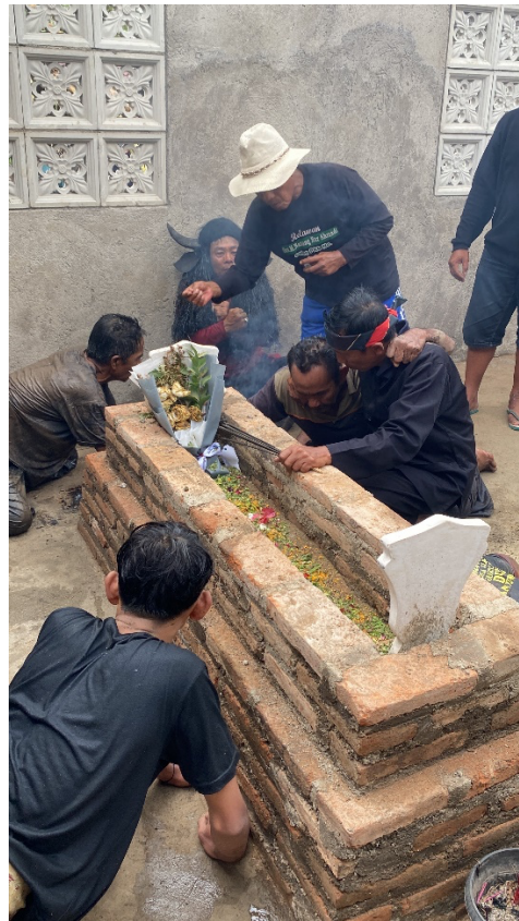
Gambar 5. Prosesi Ider Bumi Ritual Adat Keboan