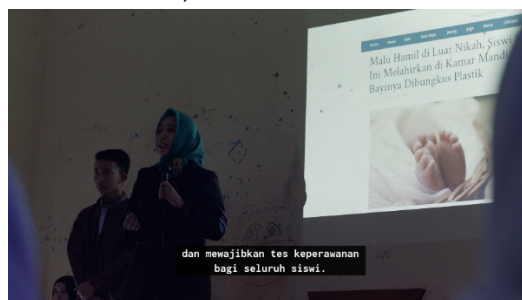
Gambar 1. Pengumuman tes keperawanan (Sumber: Film “Yuni”2021)

Gambar 1 menunjukkan sebuah adegan di mana seorang wakil bupati perempuan berbicara di depan siswa-siswi mengenai rencana pelaksanaan tes keperawanan yang harus diikuti oleh semua siswi. “Seperti yang telah dijelaskan oleh ananda Adam dari Rohis, kami sedang menyusun materi penyuluhan. Dalam waktu dekat, kami akan mengadakan dan mewajibkan tes keperawanan bagi seluruh siswi,” kata Wakil Bupati tersebut. Pengumuman yang mengejutkan ini langsung memicu keramaian di ruangan, dengan berbagai obrolan dan bisik-bisik dari para siswi.