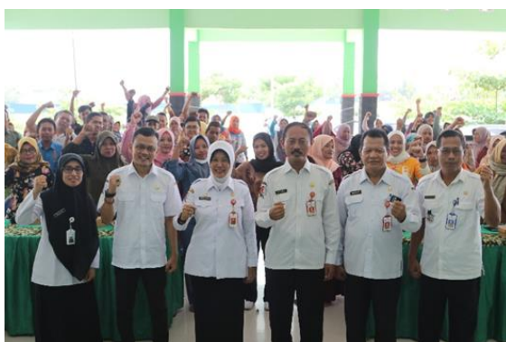
Gambar 2. Sosialisasi Program KPP

“Sosialisasi sudah kami lakukan, bekerjasama dengan SKPD (Satuan Kerja Perangkat Daerah) kecamatan dan desa, namun mengingat besaran wilayah Kabupaten Bojonegoro yang sangat luas jadi belum bisa menjangkau secara menyeluruh, namun akan tetap diupayakan” (Wawancara dengan Kepala Dindagkop UM Bojonegoro, tanggal 31 Oktober 2024).