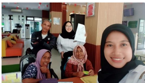
Gambar 3. Pelayanan Pembuatan KPP di Mal Pelayanan Publik

Fasilitas yang digunakan dalam implementasi program KPP di Mal Pelayanan Publik dan Dindagkop UM Bojonegoro sudah lengkap seperti komputer, mesin cetak, meja, kursi, serta lainnya. Akan tetapi sejauh ini tidak terdapat inovasi dari pemerintah terkait layanan pembuatan KPP berbasis digital dari website atau aplikasi. Segala proses untuk mendapatkan kartu pedagang hanya bisa dilakukan secara offline . Hal tersebut tentunya sangat disayangkan, di dunia serba digital seperti sekarang seharusnya ada kemajuan untuk pelayanan pembuatan KPP, yang mana akan lebih memudahkan masyarakat.