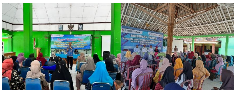
Gambar 4. Bimtek Program KPP

Nilai pendidikan berperan penting dalam menghadapi tantangan yang ada. Tanpa adanya suatu ilmu, permasalahan tidak akan bisa diselesaikan. Nilai pendidikan yang bisa didapatkan masyarakat dari program KPP berasal dari pelatihan kewirausahaan. Yang mana pada pelatihan ini pelaku usaha diajarkan terkait pemasaran digital, manajemen usaha, tendensi produk, legalitas UMKM, dan lain sebagainya. Hal tersebut bertujuan agar usaha yang dijalankan bisa lebih berkembang dan tentunya dapat bertahan dalam jangka panjang.