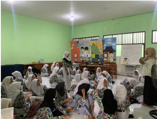
Gambar 2. Tata Busana

Kegiatan dalam Program Double Track Tata Boga dan Tata Busana untuk meningkatkan keterampilan siswa dapat dilihat dari instruktur trainer dalam melatih siswa untuk memberikan bekal keterampilan seperti halnya gambar dokumentasi dalam proses kegiatan yang diawali dengan penyampaian materi tentang dasar-dasar dari masing-masing program Double Track tersebut.