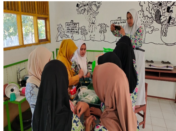
Gambar 3. Tata Boga