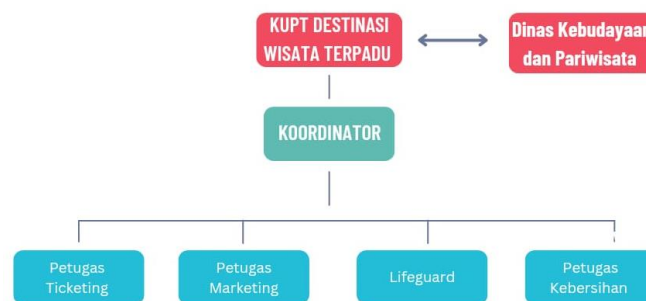
Gambar 1 : Struktur Organisasi Dander Waterpark Bojonegoro

Dalam upaya peningkatan efisiensi dan peningkatan responsifitas, pemerintah diharapkan untuk mampu memberikan tugas dan tanggung jawab kepada daerah untuk dapat mengelola urusan dari daerah masing masing. Desentralisasi adalah usaha dalam pelimpahan wewenang yang berasal dari pemerintahan pusat kepada pemerintahan daerah, atau otoritas yang lebih tinggi kepada otoritas di bawahnya (Sumpena, Nurhamidah, and Hilman 2022). Dalam hal ini dapat diartikan bawah pemerintah dinas kebudayaan memberikan wewenang kepada masyarakat sekitar maupun pegawai didalam dinas kebudayaan untuk ikut mengelola langsung, untuk memantau, maupun untuk mengkoordinasi bagaimana jalannya suatu pengembangan pariwisata di objek wisata yang menjadi kepemilikan disbudpar. Pada proses desentralisasi wewenang dalam pengelolaan objek wisata, disbudpar bojonegoro telah melakukan upaya untuk mempermudah jalannya pengembangan wisata dengan pemantauan secara langsung. Selain itu, menurut disbudpar adanya desentralisasi ini menjadi jembatan antara pihak pemerintah dengan warga untuk saling menyampaikan pendapat yang bertujuan dalam pengembangan potensi di suatu objek wisata.