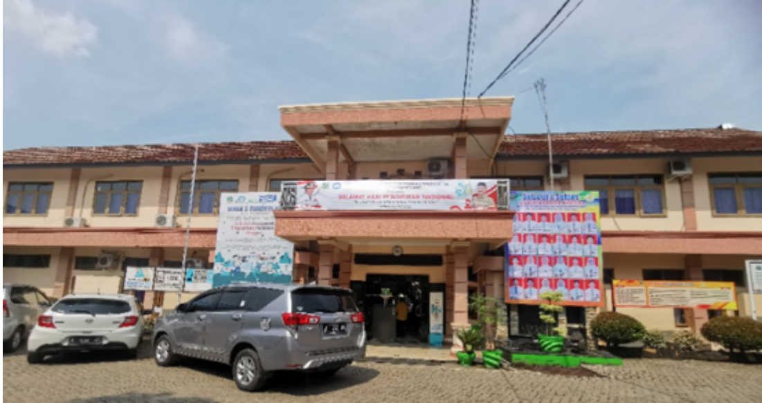
Gambar 1. Gedung Sekolah SMAN 2 Pandeglang Sumber: Dokumentasi Pribadi, 29 Agustus 2024

SMA Negeri 2 Pandeglang merupakan salah satu Sekolah Menengah Atas Negeri yang berlokasi di Jl. Pendidikan No. 41, Kelurahan Karaton, Kecamatan Majasari, Kabupaten Pandeglang, Provinsi Banten. SMA Negeri 2 Pandeglang didirikan pada 1 Januari 1975, yang telah teregistrasi di Kementerian Pendidikan dan Kebudayaan dengan Nomor Pokok Sekolah Nasional 20600468. Sama seperti SMA pada umumnya di Indonesia, masa pendidikan sekolah di SMA Negeri 2 Pandeglang ditempuh dalam waktu 3 tahun atau 6 (Semester). Mulai dari kelas X sampai dengan kelas XII. Jumlah kelas saat ini berkisaran 36 kelas dari semua jenjang. Kelas X 12 kelas, kelas XI 12 kelas, dan kelas XII 12 kelas. Data diperoleh dari Dapodik ( https://dapo.dikdasmen.kemendikbud.go.id/sekolah ).