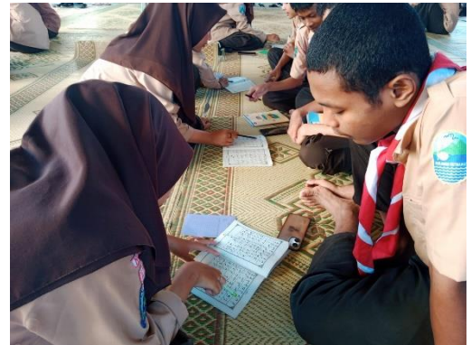
Gambar 1.3. Tutor teman sebaya