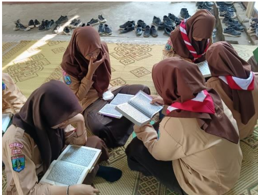
Gambar 1.2. Tutor teman sebaya (Al-Qur'an) (Iqra')