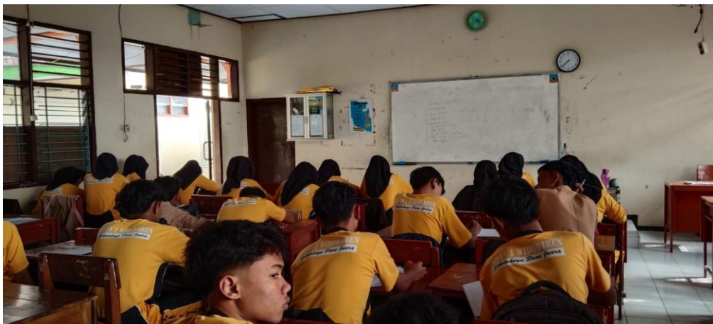
Gambar 1.4. Kegiatan Jus Gizi Jum'at Literasi