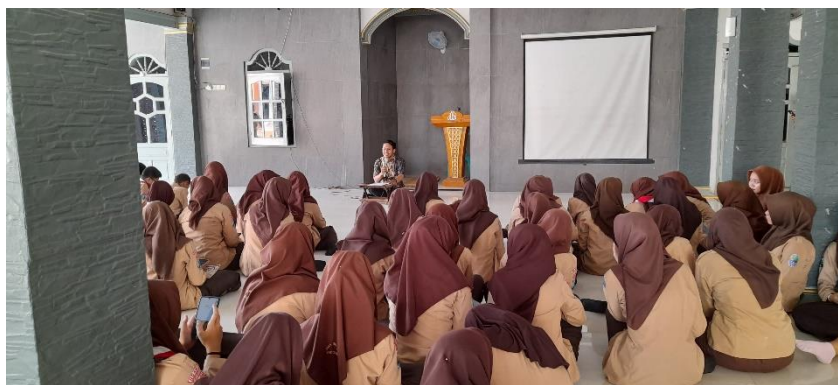
Gambar 1.1. Kegiatan BTA secara klasikal

Berikut beberapa dokumentasi kegiatan di SMA Negeri 1 Widodaren yang merupakan upaya penerapan al-kulliyatul al-khamsah dalam upaya pencegahan pergaulan bebas dan zina pada remaja usia baligh di SMA Negeri 1 Widodaren.