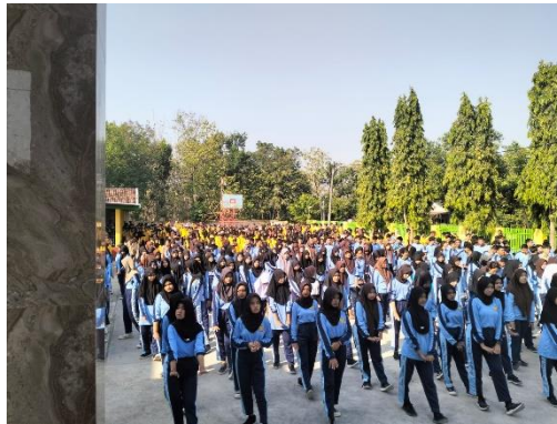
Gambar 1.5. Kegiatan Jus Gisi Jum'at Sehat