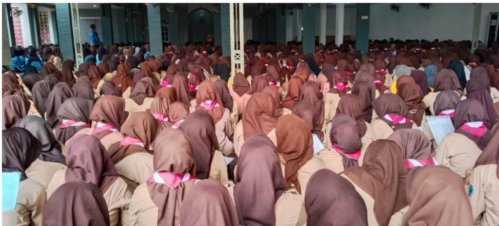
Gambar 1.6. Kegiatan Jus Gisi Jum'at Religi

Pada era sekarang ini banyak sekali anak-anak pada usia remaja yang memiliki pergaulan yang cukup bebas, arti dari pergaulan bebas adalah salah satu bentuk perilaku menyimpang yang mana “bebas” yang dimaksud adalah melewati batas norma-norma. (Abdullah, 1990).