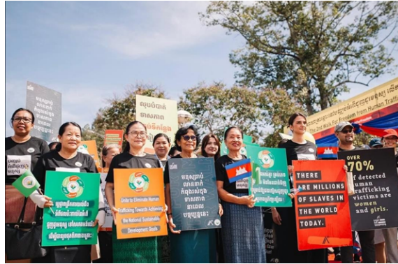
Gambar 3. Can You See Me Campaign di Thailand

Deterrence juga berfokus pada membuat pelaku tindak pidana jera dengan meningkatkan risiko dan konsekuensi dari tindakan mereka. Strategi ini dilaksanakan oleh Thailand melalui kebijakan dan tindakan pencegahan yang didukung oleh kerangka hukum yang kuat dan kolaborasi dengan aktor domestik dan internasional. Dengan demikian, penerapan Deterrence memerlukan kolaborasi dari berbagai stakeholder yang lebih luas, seperti organisasi internasional dan masyarakat sipil.