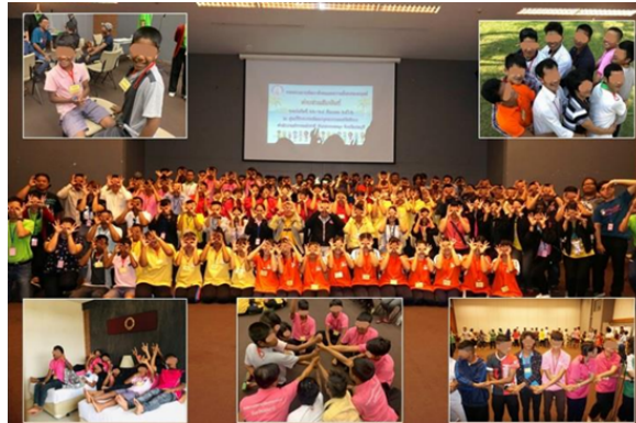
Gambar 4. Shelter Surat Thani di Thailand

pelatihan keterampilan kepada korban yang ingin kembali ke masyarakat. Para korban di dalam selter tersebut menerima perlindungan penuh dari Pemerintah Thailand. Para korban dapat menghubungi pihak keluarga, kerabat, atau pemerintah negara asal mereka melalui Kedutaan Besar Thailand, yang ditujukan kepada Kedutaan Besar negara asal korban. Selain itu, para korban diberi kebebasan untuk bekerja di luar tempat penampungan, mereka diberi kesempatan untuk berpartisipasi dalam kegiatan sosial lainnya, dan mereka diberi kesempatan untuk bersekolah di sekolah lokal seperti Trirajvitthaya School (The Royal Thai, 2019).