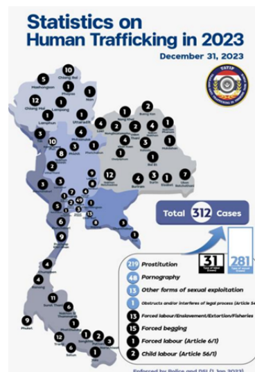
Gambar 2. Peta Statistik Perdagangan Manusia Tahun 2023 di Thailand

Wilayah atau distrik seperti Chiang Mai, Chiang Rai, Mae Hong Son, Tak, Sa Kaeo, bahkan Bangkok dikenal sebagai jalur masuk utama para korban dan pelaku perdagangan manusia, sehingga wilayah-wilayah ini menjadi pusat operasi. Data laporan tahunan Pemerintah Thailand pada tahun 2023 menunjukkan bahwa kasus perdagangan manusia paling banyak terjadi di Bangkok pada tahun 2023, dengan 49 kasus, dan 12 kasus di Chiang Mai pada tahun 2022.