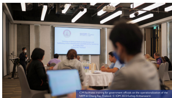
Gambar 7. Pelatihan Operasional NRM Thailand dan IOM

Pada tahun 2020, Thailand juga mengadopsi National Referral Mechanism (NRM) secara penuh. NRM melibatkan semua lembaga dalam alur penanganan yang sama untuk merujuk korban perdagangan manusia dari deteksi hingga rehabilitasi (UNODC, 2021). Dalam lima tahun terakhir, Thailand telah meningkatkan penggunaan teknologi biometrik di pos perbatasan penting seperti Mae Sot (di perbatasan dengan Myanmar) dan Aranyaprathet (di perbatasan dengan Kamboja). Sejak 2018, sistem ini digunakan untuk mencatat identitas dan aktivitas migran yang masuk dan keluar Thailand. National Referral Mechanism (NRM) bertujuan untuk mengidentifikasi, melindungi, dan mendampingi korban perdagangan manusia melalui kerja sama antar lembaga negara dan organisasi masyarakat sipil. NRM mencakup beberapa tahap penting, seperti identifikasi korban oleh petugas lapangan seperti polisi dan imigrasi, penyaringan awal dan evaluasi risiko oleh pekerja sosial, pemberian status resmi sebagai korban, dan penanganan lanjutan seperti perlindungan.