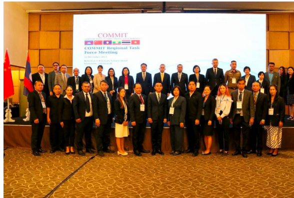
Gambar 5. Forum Regional COMMIT di Thailand