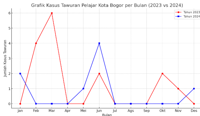
Gambar 2. Grafik Kasus Tawuran Pelajar Kota Bogor 2023-2024

Dalam hal ini, seragam batik sekolah berubah fungsi yang seharusnya menjadi simbol bangga terhadap kebudayaan justru menjadi simbol perbedaan pemicu perkelahian. Hal tersebut menjadi sebuah tantangan untuk dunia pendidikan, Perkelahian pelajar atau tawuran adalah fenomena sosial yang sering terjadi di lingkungan sekolah, terutama daerah perkotaan. Hal tersebut terjadi tidak hanya disebabkan oleh konflik antara individu saja, tetapi karena solidaritas yang berlebihan dari kelompok sekolah terhadap identitas sekolahnya