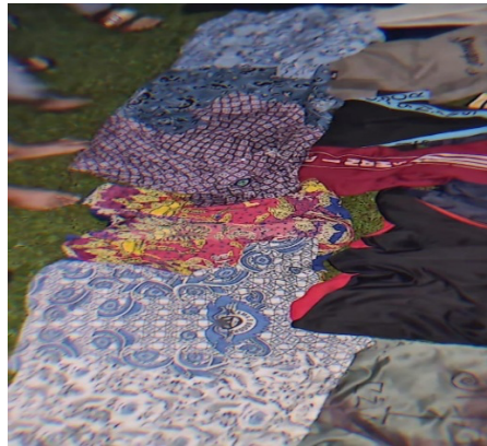
Gambar 1. Batik Sekolah Lain yang Diambil dalam Aksi Tawuran

Dalam hal ini, seragam batik sekolah berubah fungsi yang seharusnya menjadi simbol bangga terhadap kebudayaan justru menjadi simbol perbedaan pemicu perkelahian. Hal tersebut menjadi sebuah tantangan untuk dunia pendidikan, Perkelahian pelajar atau tawuran adalah fenomena sosial yang sering terjadi di lingkungan sekolah, terutama daerah perkotaan. Hal tersebut terjadi tidak hanya disebabkan oleh konflik antara individu saja, tetapi karena solidaritas yang berlebihan dari kelompok sekolah terhadap identitas sekolahnya