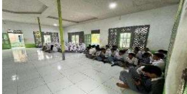
Gambar 2. Siswa Siswi MA Hidayatul Muslimin 2 saat mengikuti Pelatihan

praktik langsung dengan pendampingan intensif ini berhasil memperbaiki kesalahan teknis baca Al-Qur'an secara bertahap, membangun kemampuan siswa secara berkelanjutan.