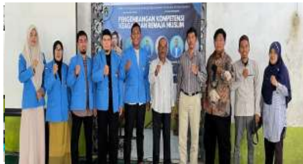
Gambar 1. Dosen Pembimbing, Kepala dan Guru MA Hidayatul Muslimin 2 Beserta 5 Mahasiswa MPAAI IAIN Pontianak saat melaksanakan Kegiatan PKM

Fenomena ini bukanlah hal yang asing dalam konteks pendidikan agama Islam di berbagai madrasah, di mana pembelajaran tajwid dan khotbah masih banyak berorientasi pada teori dan kurang memberikan ruang praktik yang cukup, sehingga siswa tidak memiliki kesempatan memadai untuk mengasah keterampilan secara nyata. Hal ini sesuai dengan temuan Filasofa (2021) dan Rahman & Saputra (2020), yang menyatakan bahwa pembelajaran tajwid di madrasah masih menghadapi berbagai tantangan terutama dalam mengoptimalkan latihan praktik yang berkelanjutan. Ketidakyakinan siswa dalam membaca Al-Qur'an sesuai kaidah serta rasa gugup yang kerap menghantui saat berkhotbah menjadi hambatan utama yang berkontribusi pada rendahnya skor kemampuan awal.