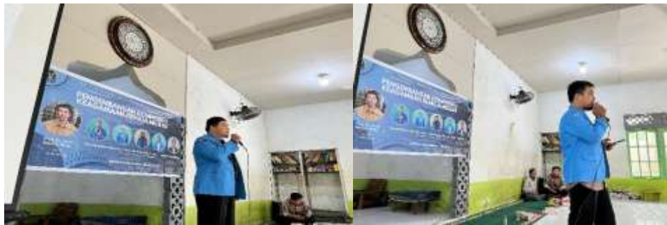
Gambar 3. Kegiatan menyampaikan Pengetahuan Khotbah dan Ilmu Tajwid oleh Narasumber

Kemampuan berkhotbah yang meningkat mencapai menunjukkan perubahan besar dalam aspek komunikasi dan dakwah para peserta. Keterampilan khotbah bukan hanya sebatas kemampuan menyampaikan materi tetapi juga mencakup seni berkomunikasi secara efektif melalui bahasa verbal dan nonverbal. Setelah pelatihan, siswa yang sebelumnya merasa takut dan kurang percaya diri mampu tampil lebih tenang dan komunikatif, menyampaikan khotbah yang jelas dan menarik (Yasyakur, 2017; Said & Khairullah, 2017).