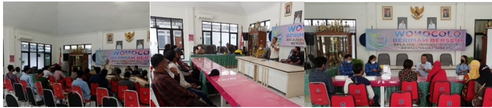
Gambar 5. Kegiatan Pengarahan Program Padat Karya di Kecamatan Wonocolo

melibatkan organisasi perangkat daerah (OPD) pengampu yang memiliki tanggung jawab sesuai dengan bidang usaha masing-masing.