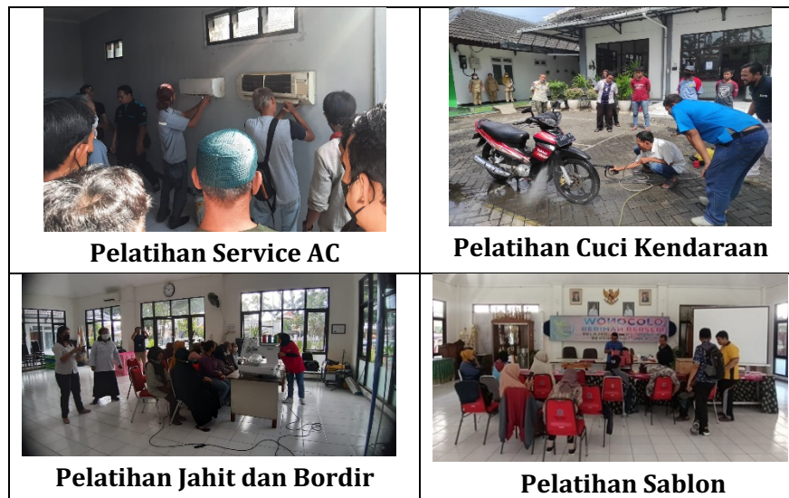
Gambar 2. Pelatihan padat karya di Kecamatan Wonocolo

Penguatan menurut (Suharto, 2014) dapat diartikan sebagai memperkuat ilmu pengetahuan dan keterampilan yang belum dimiliki oleh masyarakat, sehingga mereka dapat berpartisipasi dalam pemecahan masalah dan memenuhi kebutuhan mereka. Berdasarkan hasil penelitian ini, penguatan program padat karya kepada masyarakat dilakukan melalui kegiatan pelatihan. Setiap jenis usaha yang dibentuk mendapatkan pelatihan, baik sebelum program dimulai maupun selama program berjalan, yang dilaksanakan dalam beberapa tahap.