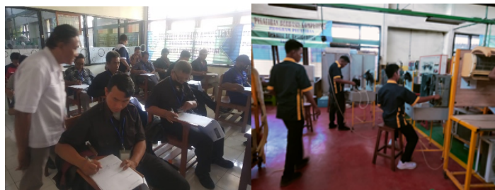
Gambar 3. Pelatihan Service AC di BLK Surabaya