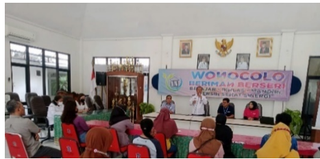
Gambar 1. Pembinaan Program Padat Karya oleh Camat Wonocolo

Jenis usaha ini dibuat berdasarkan potensi dan keterampilan yang dimiliki warga setempat. Sebelum diresmikan, Dinas Koperasi Usaha Kecil, Menengah, dan Perdagangan (Dinkopdag) Kota Surabaya melakukan survei untuk mengetahui minat dan preferensi usaha di kalangan masyarakat miskin di wilayah tersebut. Setelah dibentuklah beberapa usaha tersebut, Camat Wonocolo memberikan pengarahan kepada Pemerintah kelurahan, lalu diteruskan ke RT dan RW, untuk disosialisasikan kepada masyarakat miskin agar mereka mau ikut berpartisipasi ke dalam program padat karya ini. Tujuannya yaitu untuk memberikan pekerjaan dan menambah penghasilan warga, sehingga bisa membantu mengurangi angka kemiskinan di Wonocolo. Hal yang sama juga dilakukan untuk dua usaha baru, yaitu produksi paving dan sablon, yang mulai diresmikan pada tahun 2023. Hal ini merupakan bentuk upaya pemerintah Kecamatan Wonocolo agar Masyarakat miskin di Kecamatan Wonocolo mengetahui adanya program ini dan manfaat yang akan didapatkan Masyarakat.