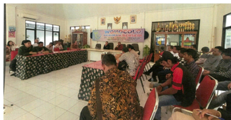
Gambar 6. Kegiatan Pembentukan Kelompok Usaha Padat Karya Produksi Paving

Pendampingan terhadap usaha service AC menunjukkan bentuk perhatian yang cukup intensif dari pemerintah kecamatan maupun Dinas Perindustrian dan Tenaga Kerja (Disperinaker) Kota Surabaya OPD pengampu, meskipun usaha ini tidak beroperasi secara menetap di rumah padat karya. Komunikasi dilakukan secara rutin melalui telepon dan pesan singkat sebagai sarana untuk memantau perkembangan usaha dan menjalin kedekatan dengan pelaku usaha. Sedangkan pada usaha cuci kendaraan, pendampingan dilakukan pada tahap awal melalui monitoring dan bantuan akses pasar. Namun, pendampingan tidak dilanjutkan secara berkelanjutan hingga saat ini yang berdampak pada pelaksanaan usaha. Sementara itu, usaha jahit dan bordir mendapatkan pendampingan aktif dari pemerintah kecamatan pada tahap awal pelaksanaan. Bentuk pendampingan mencakup komunikasi melalui grup daring. Namun, intensitas pendampingan mulai menurun seiring waktu akibat menurunnya aktivitas usaha dari para pelaku. Kemudian, usaha sablon juga mendapatkan bentuk pendampingan dari Pemerintah Kecamatan Wonocolo, terutama melalui kegiatan monitoring dan dukungan promosi. Pendampingan ini meskipun tidak dilakukan secara rutin, namun tetap dilaksanakan secara berkala.