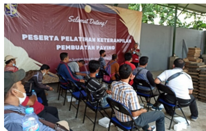
Gambar 4. Pelatihan Program Padat Karya Produksi Paving di Kecamatan Wonocolo

memperoleh sertifikat kompetensi sebagai bentuk pengakuan atas keterampilan yang dimiliki sehingga diharapkan meningkatkan kepercayaan diri peserta dan menjadi legalitas dalam mengembangkan usaha di bidang perbaikan AC. Pelatihan menjahit juga pernah diselenggarakan oleh Dinas Koperasi UMK dan Perdagangan Kota Surabaya selaku OPD pengampu usaha ini, yang mencakup peserta dari berbagai kecamatan termasuk Kecamatan Wonocolo. Di sisi lain, usaha produksi paving mendapat dukungan penuh dari Dinas Sumber Daya Air dan Bina Marga Kota Surabaya, yang bekerja sama dengan Institut Teknologi Sepuluh November (ITS) dan Disperinaker, serta diikuti oleh dua kelompok dari Kelurahan Siwalankerto dan Jemurwonosari. Materi yang diberikan bersifat teknis dan aplikatif guna memastikan peserta mampu memproduksi paving berkualitas sesuai standar.