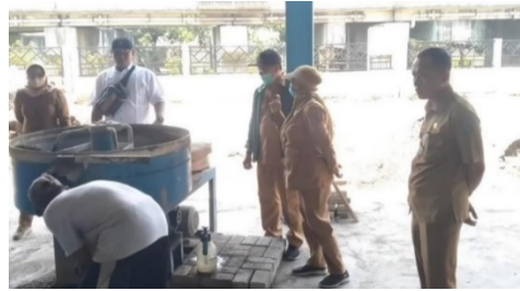
Gambar 8. Monitoring usaha produksi paving oleh Pemerintah Kecamatan Wonocolo bersama Pemerintah Kelurahan Siwalankerto