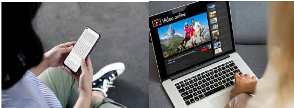
Gambar 2. Konten di Medsos Mempengaruhi Pemikiran Manusia Membaca Artikel di Hp Seseorang yang sedang Menonton Video Layar Laptop

Di era digital, media sosial telah menjadi ruang baru yang membentuk pola pikir manusia secara signifikan. Platform seperti YouTube, Instagram, dan TikTok tidak lagi hanya berfungsi sebagai sarana hiburan, tetapi juga sebagai ruang dialogis yang aktif dalam membangun pemahaman. Melalui bahasa, simbol, dan visual yang dikonstruksikan dalam konten digital, terjadi proses pembentukan kesadaran yang memengaruhi cara seseorang berpikir, merasa, dan bertindak. Konten-konten tersebut membawa narasi dan nilai yang jika dikonsumsi secara berulang akan tertanam dalam struktur berpikir individu maupun kelompok masyarakat. Misalnya, pernyataan “kegagalan adalah bagian dari kesuksesan” dalam video motivasi tidak hanya menyampaikan informasi, tetapi juga mentransformasi makna kegagalan dalam benak penerimanya. Proses ini menunjukkan bahwa bahasa dalam media sosial memiliki kekuatan performatif, yang secara halus membentuk cara pandang pengguna terhadap dunia. Melalui pemakaian ulang yang terus-menerus, bahasa dalam ruang digital turut menciptakan realitas baru dalam kesadaran manusia (Sen, Prybutok, and Prybutok 2022). Oleh sebab itu, konten digital berperan aktif dalam membentuk arah berpikir dan persepsi sosial masyarakat masa kini. Berikut adalah bentuk visualisasi dari proses transformasi tersebut: