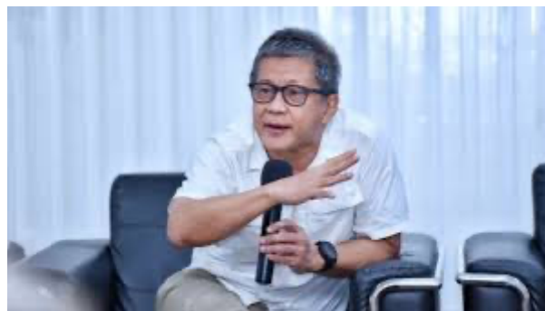
Gambar 3. Tokoh Inspiratif yang Dapat Mempengaruhi Emosi dan Cara Berpikir Seseorang