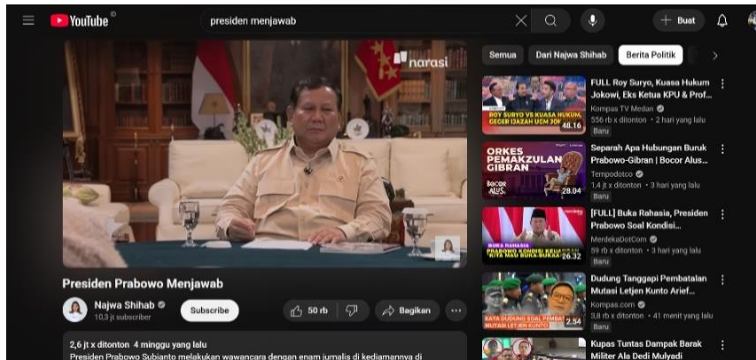
Gambar 1. Konten Video “Presiden Prabowo Subianto”

Shihab telah meraih 10,4 juta subscriber dengan jumlah video sebanyak 2,7 ribu dalam rata-rata penonton yang mencapai hitungan jutaan penonton di setiap episodenya.