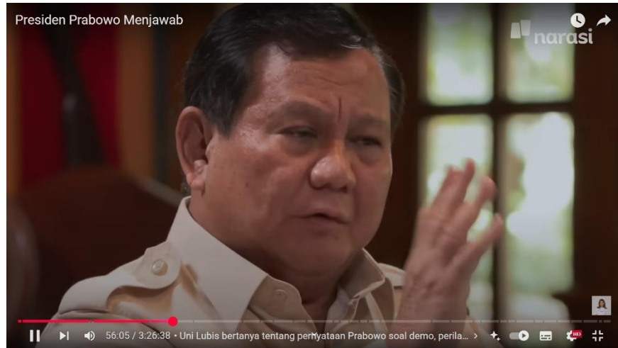
Gambar 2. Tren Kasus Harian dan Kematian Harian Masa Pandemi Covid-19

Dengan menggunakan teknik analisis wacana digital milik Rodney H. Jones, peneliti menyusun penelitian ini berdasarkan beberapa unsur utama, yaitu elemen teks, konteks, tindakan dan interaksi, serta ideologi dan kekuasaan. Pada elemen teks, fokus analisis diarahkan pada bagaimana bentuk dan isi teks yang muncul dalam video Presiden Prabowo Menjawab yang diunggah di kanal YouTube Najwa Shihab. Sementara itu, pada elemen konteks, analisis mencakup bagaimana video tersebut dibuat, alasan di balik pembuatannya, serta siapa saja yang terlibat di dalamnya, baik secara langsung maupun tidak langsung. Pada elemen tindakan dan interaksi, peneliti menelaah respons publik terhadap video tersebut, yang dianalisis melalui kolom komentar di YouTube, serta reaksi pengguna di media sosial seperti Instagram, Twitter (X), dan TikTok. Terakhir, dalam elemen ideologi dan kekuasaan, penelitian ini bertujuan untuk mengungkap ideologi-ideologi tertentu yang mungkin terkandung dalam video Presiden Prabowo Menjawab, khususnya dalam konteks relasi kekuasaan yang disampaikan melalui narasi video tersebut.