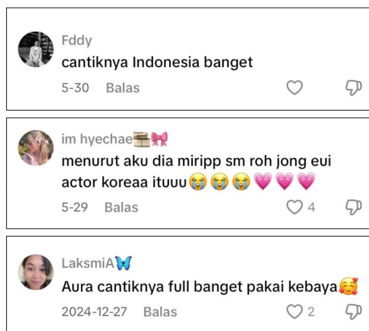
Gambar 6. Komentar Pada Postingan TikTok Dara Sarasvati