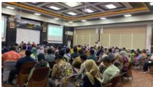
Sumber : Bappedalitbang, Tahun 2024

Ansell dan Gash dalam Qomariyah (2023) menyatakan bahwa desain kelembagaan merujuk pada kerangka dasar yang mengatur kolaborasi. Desain kelembagaan memperhatikan tiga aspek yaitu inklusivitas partisipatif, forum terbatas, dan aturan dasar yang jelas dan transparansi proses. Desain kelembagaan merupakan unsur-unsur yang secara terorganisasi dalam hal ini meliputi baik dari unsur pemerintah, swasta, dan juga masyarakat umum. Partisipasi aktor yang terlibat dalam pelaksanaan program padat karya di kecamatan semampir kota Surabaya tercantum pada Peraturan Walikota Nomor 83 tahun 2023. Dalam Peraturan tersebut berisi peran dari pemerintah, perusahaan, dan masyarakat khususnya masyarakat miskin. Pemerintah Daerah dalam hal ini memiliki peran sebagai fasilitator. Setiap OPD pengampu memfasilitasi pemberian bantuan alat maupun modal usaha. Sementara itu, perusahaan swasta berperan sebagai mitra dalam hal pelatihan maupun pendukung dalam hal pendanaan dan masyarakat miskin juga berpartisipasi dalam program. Selain inklusivitas partisipatif, forum terbatas sudah dilakukan melalui pertemuan rutin.