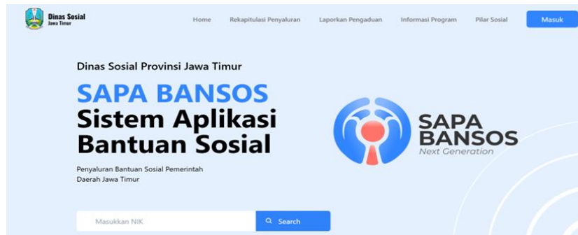
Gambar 1. Tampilan Aplikasi SAPA BANSOS

sistem aplikasi menjadi tantangan sekaligus kemajuan penting dalam Program Keluarga Harapan (PKH Plus) di Kecamatan Driyorejo Kabupaten Gresik.