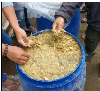
Gambar 4. Pakan Ternak Silase

Kemudian, melalui pelatihan sektor pertanian pada komoditas peternakan sapi perah memberikan pengetahuan dan pengalaman kepada masyarakat dalam pengelolaan sektor pertanian antara lain perawatan hewan ternak, kebersihan hewan ternak, teknik pemerahan susu hewan ternak, dan sebagainya. Selain itu, pelatihan sektor pertanian mendorong masyarakat untuk menggunakan pendekatan praktik modern. Hal tersebut mendukung masyarakat untuk transformasi menjadi petani yang lebih inovatif, produktif, berkelanjutan, dan berdaya saing di sektor pertanian modern.