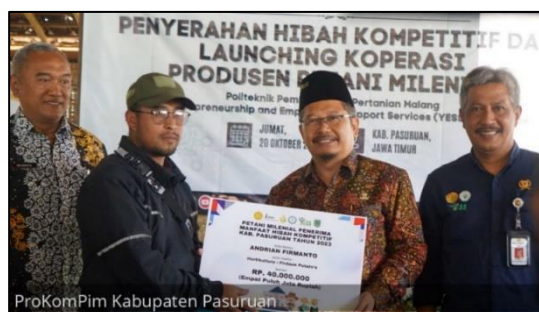
Gambar 6. Launching Koperasi Produsen Petani Milenial

Selain itu, adapun upaya-upaya lain sebagai perlindungan atau keberpihakan yang berikan melalui Youth Entrepreneurship and Employment Support Services (YESS). Upaya tersebut diantaranya melalui pembentukan koperasi produsen petani milenial yang mempunyai program kerja untuk pemasaran produk pertanian dari penerima manfaat program Youth Entrepreneurship and Employment Support Services (YESS) di Desa Puspo Kabupaten Pasuruan. Dengan koperasi produsen petani milenial, produk-produk pertanian dari masyarakat penerima manfaat program Youth Entrepreneurship and Employment Support Services (YESS) dapat dibeli dan dipasarkan oleh koperasi tersebut.