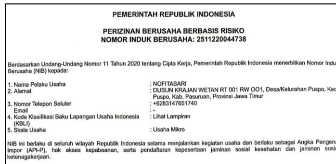
Gambar 5. Sertifikat Izin Berusaha

Berdasarkan temuan di lokasi penelitian, tahap protecting sebagai upaya dalam memberikan keberpihakan kepada masyarakat petani muda Desa Puspo Kabupaten Pasuruan direalisasikan dengan berbagai langkah-langkah melalui program Youth Entrepreneurship and Employment Support Services (YESS) antara lain terdapat upaya perlindungan yang dilakukan berupa pendampingan dalam kepengurusan izin untuk usaha sebagai berikut :