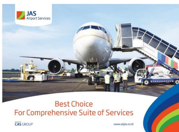
Gambar 2.1 Gambar CAS Group