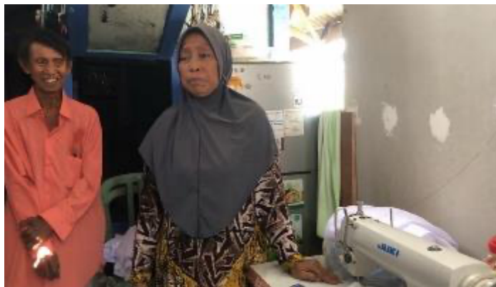
Gambar 2. Program Padat Karya Pelatihan Mesin Jahit

Terkadang saya menemui data masyarakat yang tidak sesuai dengan realita, saya memberikan pengertian bahwa implementasi program padat karya hanya untuk masyarakat yang memiliki pendapatan dibawah Rp. 4.000.000 saja. Ada juga masyarakat yang sudah menjadi sasaran program tetapi menolak mbak, mereka punya pekerjaan lain, lebih memilih mengurus anak dan mengembangkan usaha sendiri.