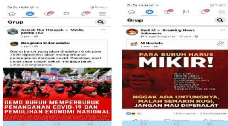
Gambar 3. Contoh postingan di media social.

Berikut beberapa petunjuk etika komunikasi media sosial yang benar menurut Turnip & Siahaan (2021):