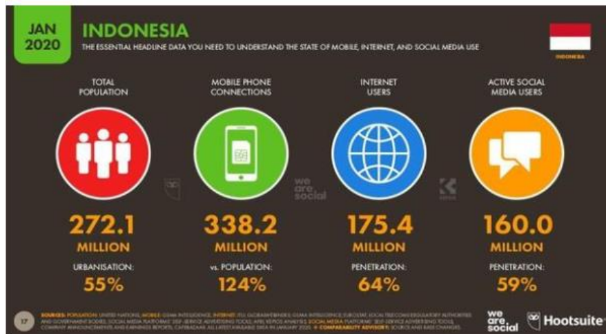
Gambar 2. Jumlah Pengguna Media Sosial di Indonesia Tahun 2020.

Menurut Faulida (2020) media sosial hanyalah konten online yang memfasilitasi interaksi sosial dengan memanfaatkan teknologi berbasis web untuk mengubah komunikasi menjadi wacana interaktif. Ciri-ciri media sosial antara lain: