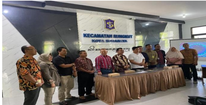
Gambar 1. Sosialisasi NIB dan SPP-PIRT di Kecamatan Rungkut

usahanya, khususnya SPP-PIRT. Strategi ini telah menunjukkan keberhasilan awal dalam meningkatkan jumlah pelaku UMKM yang mengajukan sertifikasi, meskipun masih terdapat kendala berupa rendahnya partisipasi di beberapa wilayah.