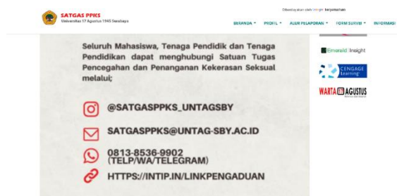
Gambar 2. Produk pelayanan satgas

Sesuai dengan arahan Permendikbudristek No 55 Tahun 2024 tentang satgas PPKPT, maka korban berhak untuk mendapatkan perlindungan hukum, pendampingan psikologis, serta menyediakan sarana informasi pada setiap perguruan tinggi untuk media pelaporan. Selain itu setiap perguruan tinggi juga harus menjaga kerahasiaan data pribadi korban yang melapor dan melakukan penjagaan terhadap korban agar tidak terjadi intimidasi pada korban tindak kekerasan, serta korban juga berhak mendapatkan hak untuk tetap bekerja, mengampu pendidikan atau melakukan aktivitasnya sehari hari dengan aman. (Munir et al., 2019)