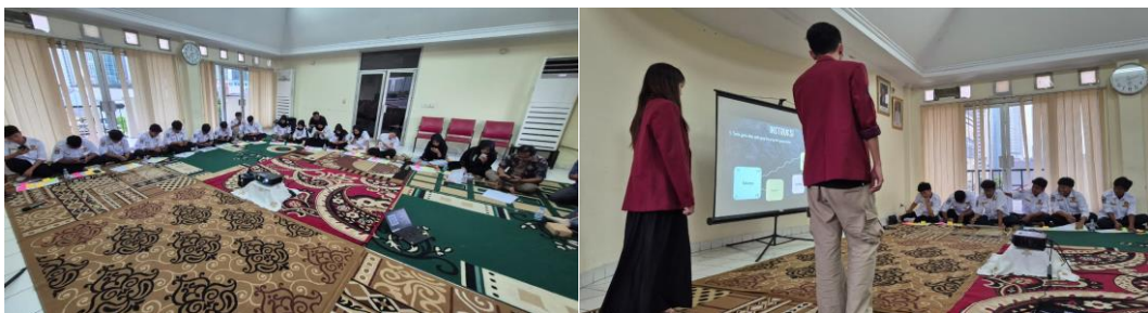
Gambar 1. Dokumentasi Kegiatan Intervensi Relate & Elevate kepada para Anggota Karang Taruna RW.004 Kelurahan Karet Semanggi.

Intervensi dengan pendekatan experiential learning , melalui praktik Social Identity-Mapping (SIM) dan psikoedukasi yang diberi judul ' Relate & Elevate ' ini berhasil memberikan pemahaman dan peningkatan aspek Relatedness pada para anggota Karang Taruna RW.04 Kelurahan Karet Semanggi.